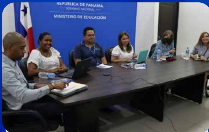
Cambio de coordinación para segundo semestre 2022

Presentación del informe de avances de las cinco metas priorizadas al año 2022.