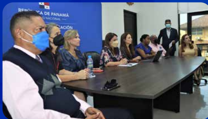
Cambio de coordinación para primer semestre 2022 y presentación del informe de gestión anual 2021