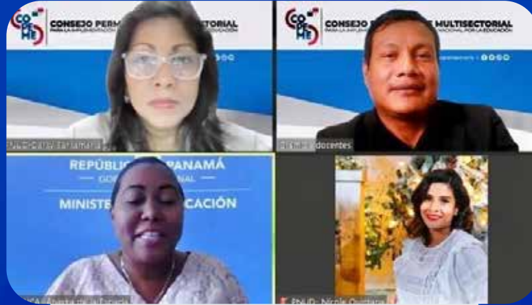
Cambio de coordinación para primer semestre 2022 y presentación del informe de gestión anual 2021