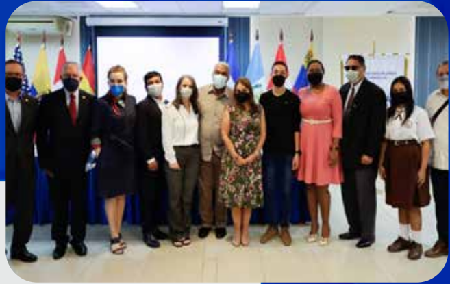
Meduca entrega primer informe de avance del Plan de Acción, que corresponde al 2021