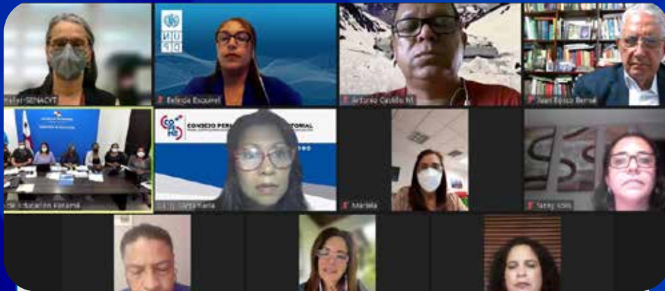
MEDUCA presenta al COPEME el plan de retorno a clases 2022