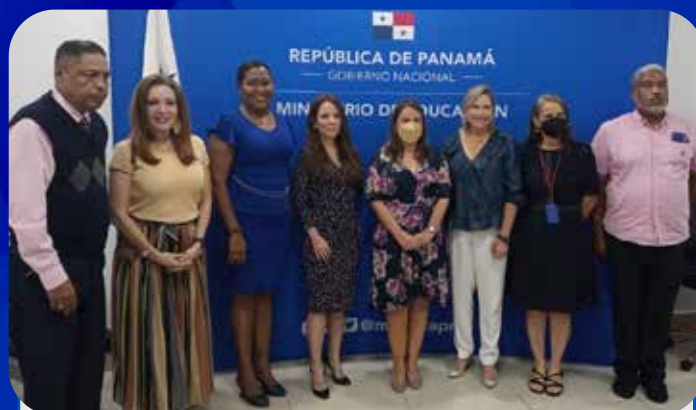
Presentación del informe de gestión del primer semestre 2021