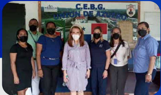
Gira a la región educativa de Panamá Este-distrito de Chepo