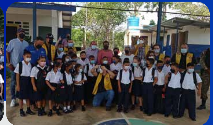
COPEME participa de actos de inicio del año escolar 2022