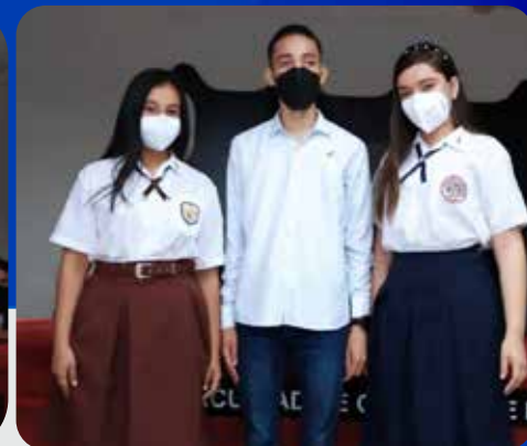
Elección del nuevo representante estudiantil