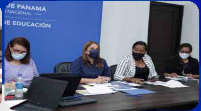
MEDUCA presenta al COPEME el plan de retorno a clases 2022